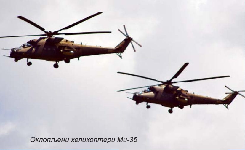
Оклопљени хеликоптери Ми-35