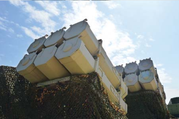
Основни тренд у савременим технологијама за производњу оружја су ракетни системи