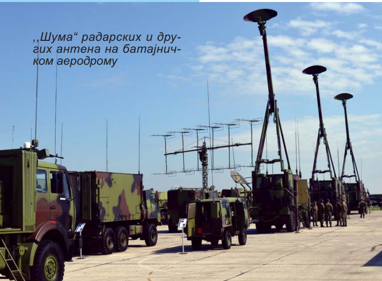
„Шума“ радарских и других антена на батајничком аеродрому