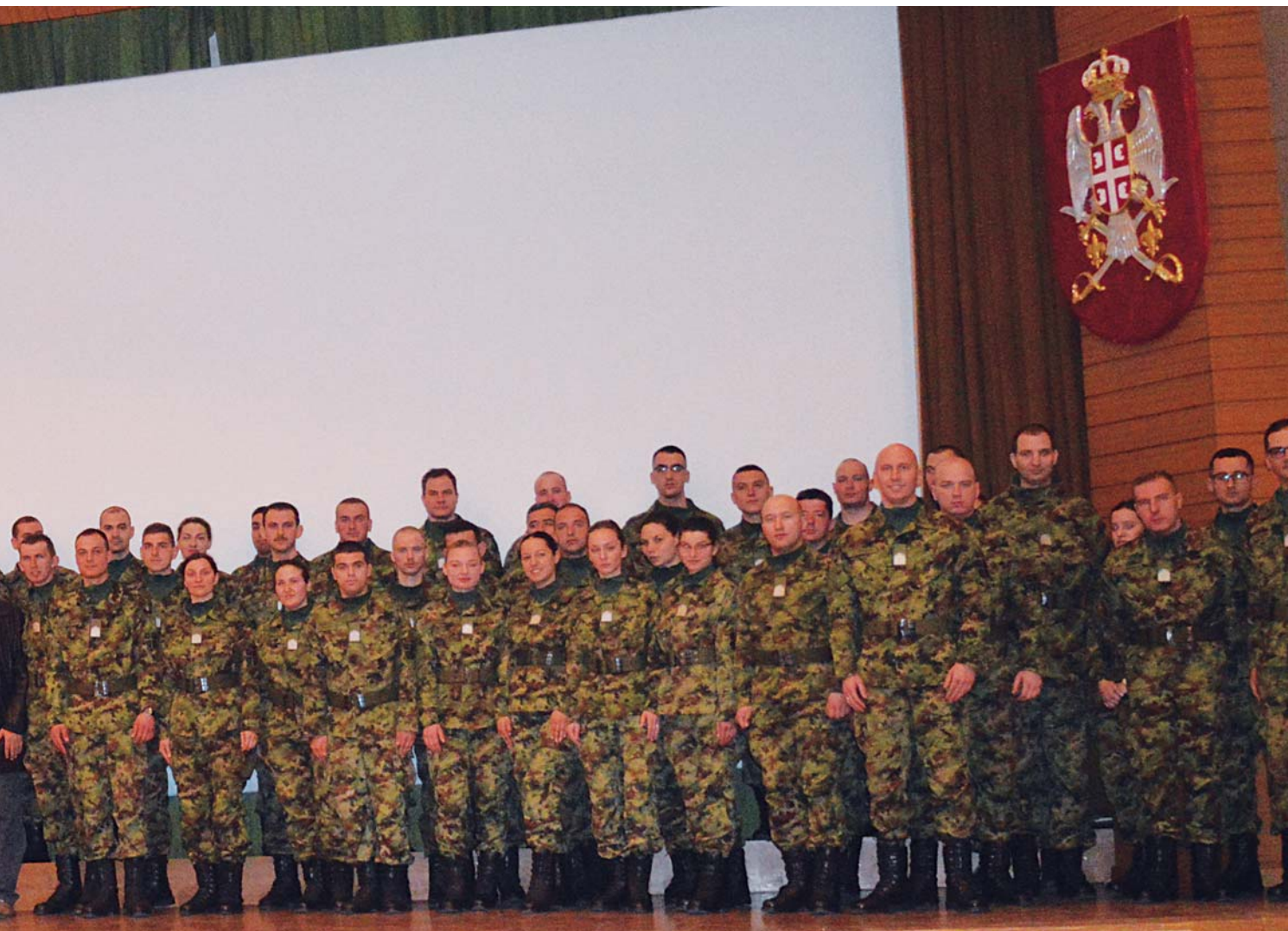
Заједнички снимак за сећање на време проведено у Војној академији