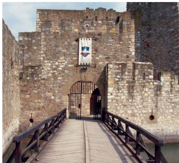
Улаз у тврђаву