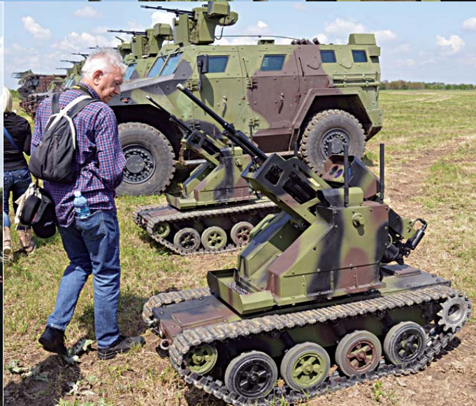
„Мали милош“ не престаје да изазива пажњу љубитеља наоружања