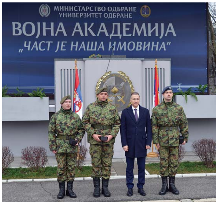
Министар одбране са тројицом најуспешнијих резервних официра

Указом председника Републике и врховног команданта Војске Србије Александра Вучића у чин резервног потпоручника промовисано је 77 слушалаца Курса за резервне официре генерације „Септембар 2021“. Министар одбране др Небојша Стевановић, на свечаности у Војној академији им је поручио: „Тражим од вас да никад не заборавите речи које сте изговорили, речи којима гарантујете да ћете бити увек подршка својој Србији, да ћете бити подршка њеном народу и да ћете увек и у сваком тренутку бити уз своју отаџбину.“