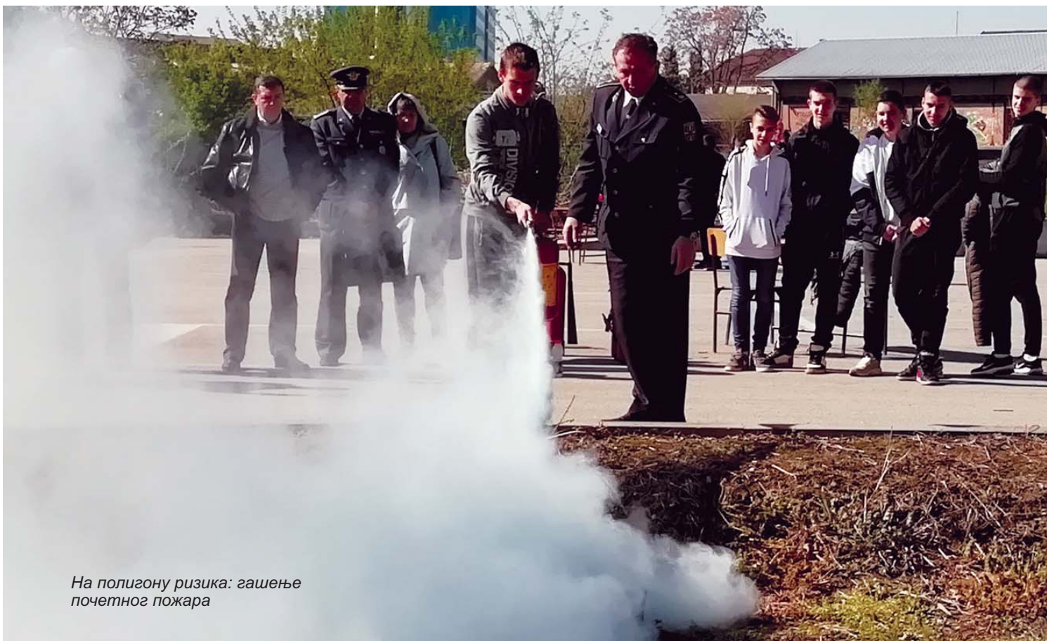
На полигону ризика: гашење почетног пожара