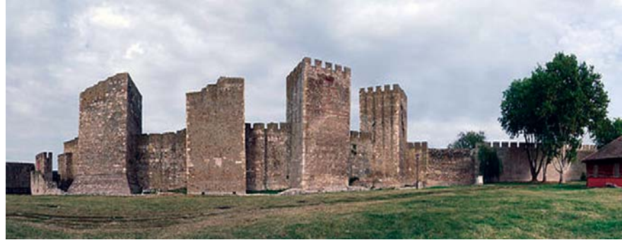
Лепота која траје вековима