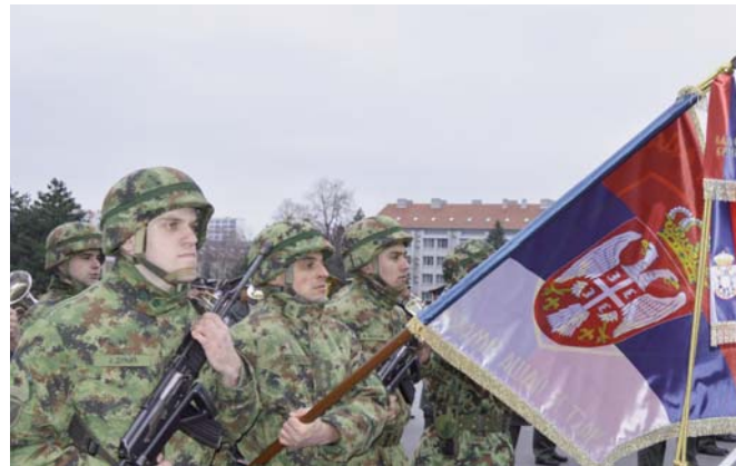
Застава је симбол наших победа и опстанка

ким човеком, али се трудим да чујем шта су мотиви ових људи да постану део Војске и шта је то што ми можемо да урадимо да унапредимо њихов статус и шта је оно што заједнички можемо да урадимо за нашу земљу, а што је најважније. И драго ми је да чујем од ваших старешина да су задовољни вашим залагањем и трудом и да је ваша класа показала изузетне резултате, јер тих шест месеци које сте провели на овом курсу нису били лаки. То су били месеци искушења и изазова, али и добре школе посебно за вас ко-