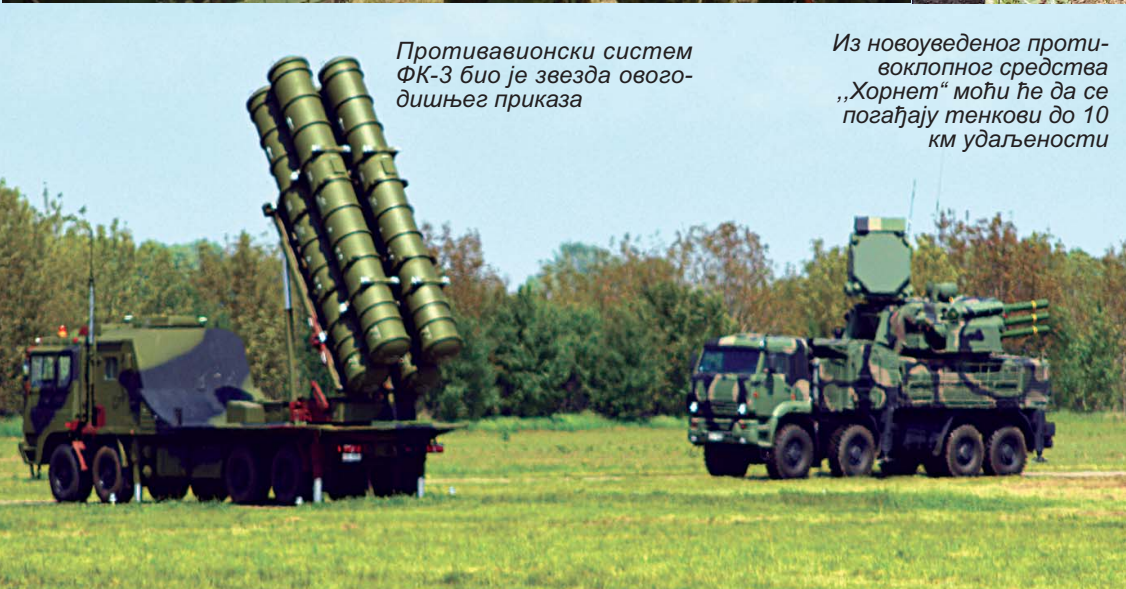
Противавионски систем ФК-3 био је звезда овогodiшњег приказа