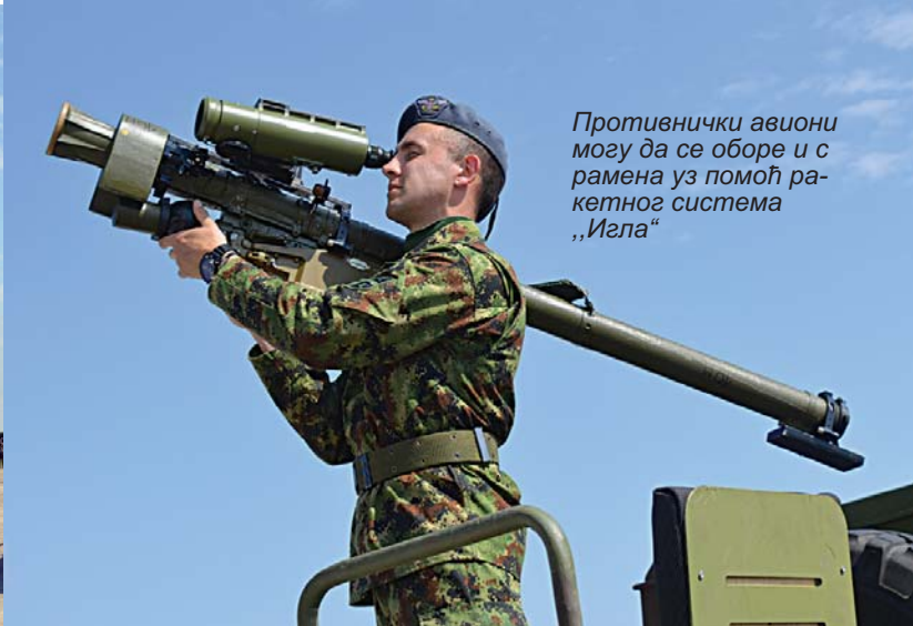
Противнички авиони могу да се оборе и с рамена уз помоћ ракетног система „Игла“