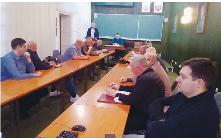
Делегати РВС Новог Сада на седници Скупштине ОРВС