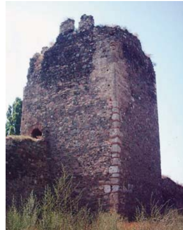
Зуб времена је оставио трага на једној од кула