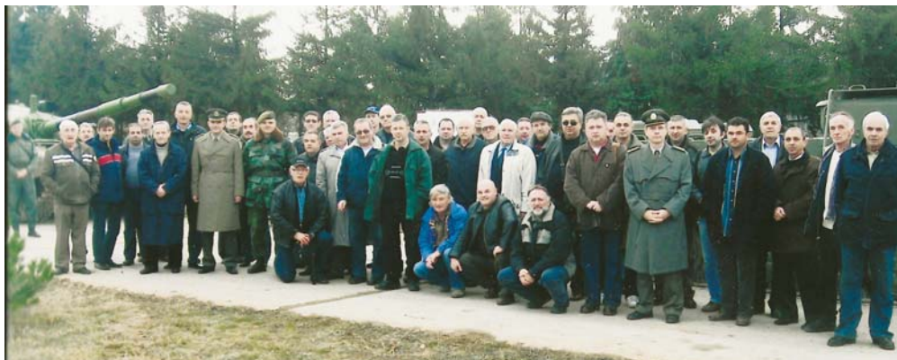
Резервне војне старешине приликом посете 3. бригади КоВ

У реализацији тежишних програмских задатака пуну помоћ (организациону и ону на терену) пружала је и пружа Команда Тимочке бригаде, односно Команда за развој Тбр. Ватрена и тактичка обука, а делом информисање, не би било могуће реализовати искључиво снагама и средствима ОРВС. Зато се успешан рад заснива на сарадњи са командама Војног одсека односно Центра Министарства одбране Зајечар и Бор.