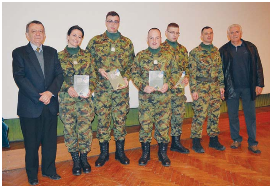
Потпоручницима су подељена и пригодна издања СОРВСС

У наставку излагања председник СОРВСС је рекао да организација резервних војних старешина делује у око 80 општина и градова у Србији са више од 15.000 чланова. Припада организацијама са стажом дужим од једног века, а саздана је на патриотизму. Да би били спремни за оно што их чека у ратним јединицама, тек свршени резервни официцири морали би да буду готово у свакодневном контакту са Војском Србије. То могу да остваре преко ОРВСС. Организације резервних војних старешина везане су за