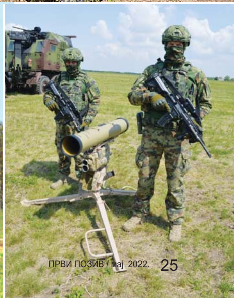
Из нововведеног противоклопног средства „Хорнет“ моћи ће да се погађају тенкови до 10 км удаљености