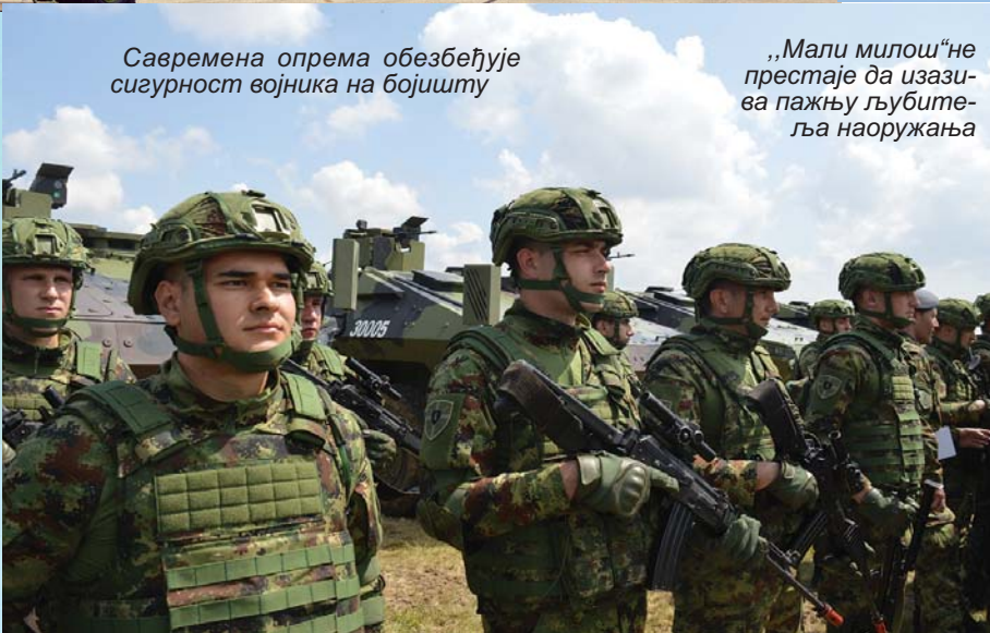
Савремена опрема обезбеђује сигурност војника на бојишту