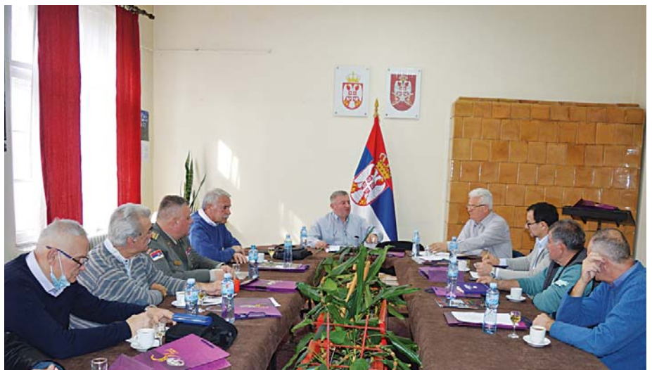
Ваљево има дугу традицију организације резервних војних старешине