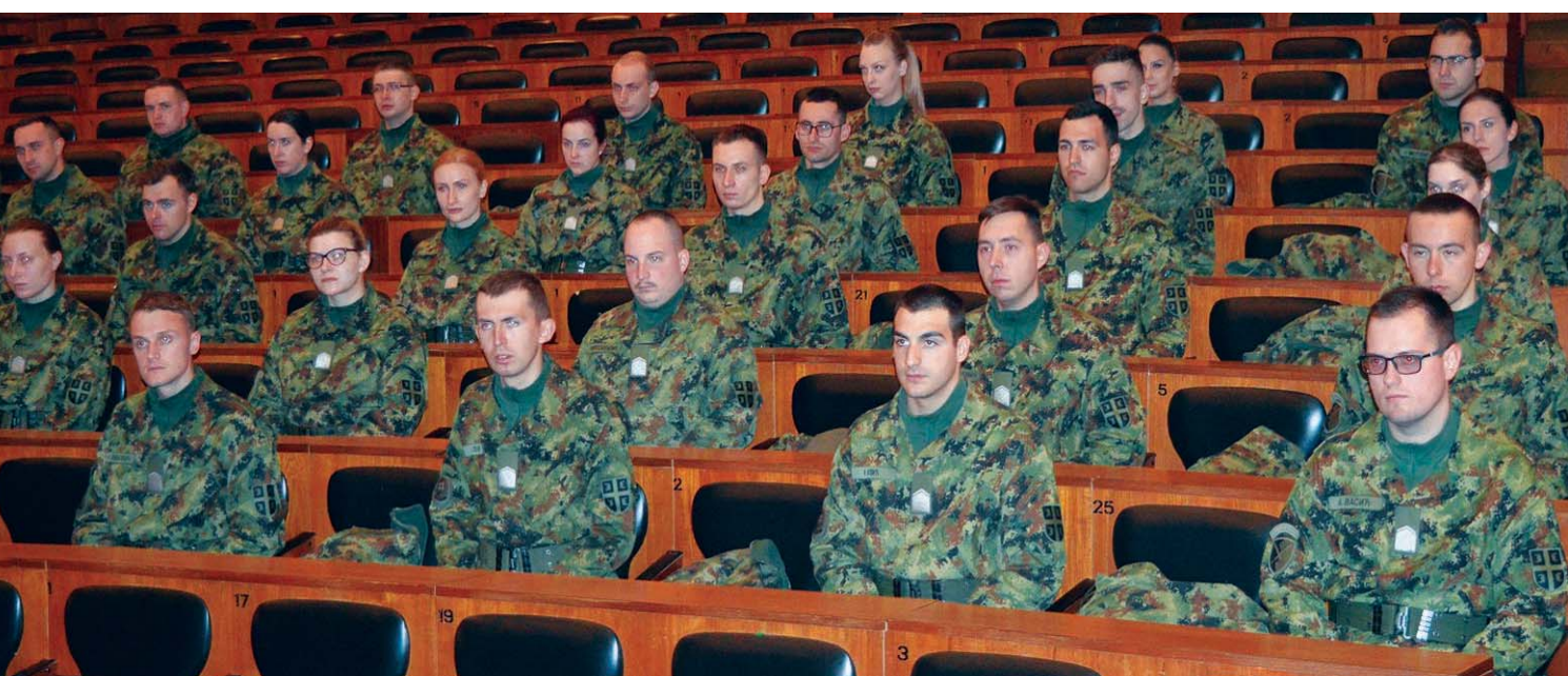
Млади официри су пратили излагање председника СРВСС са посебном пажњом