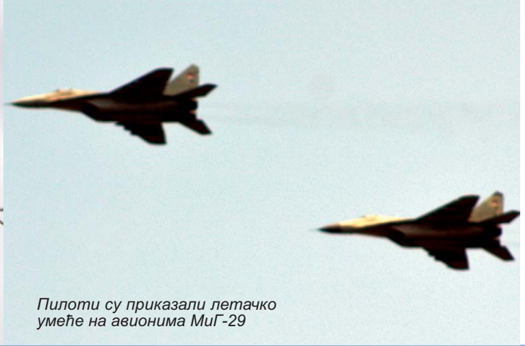
Пилоти су приказали летачко умеће на авионима МиГ-29