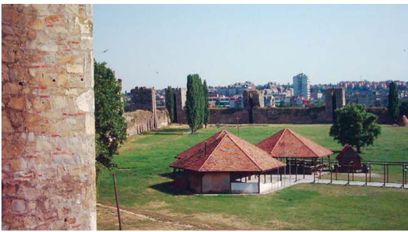
Између зидина је велико пространство