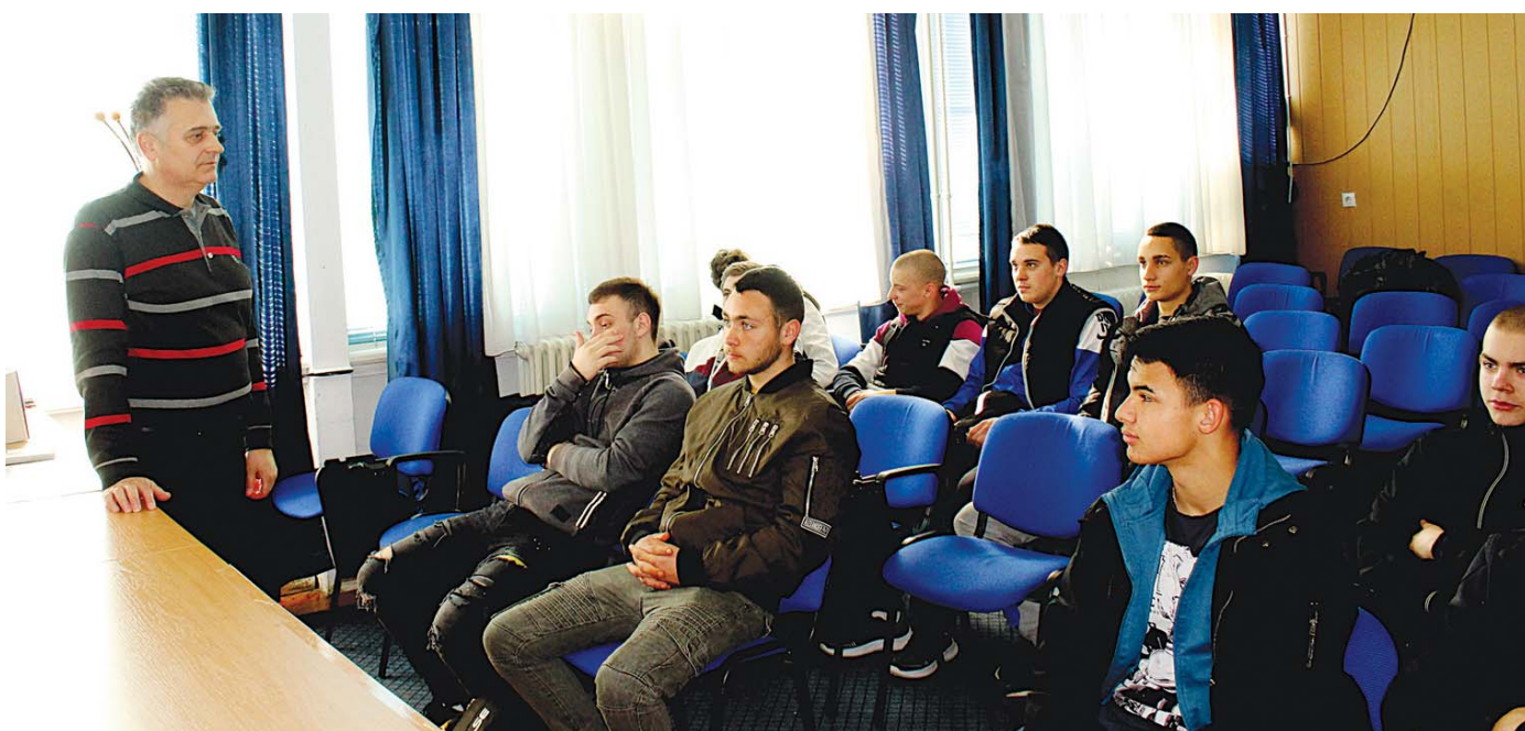
Са предавања у Техничкој школи

У Техничку школу у Зрењанину из године у годину се уписује све више ученика. У занатима је будућност, као да желе да кажу у руководству ове школе наводећи да имају 760 ђака распоређених у 29 одељења за седам образовних профила машинства и обраде метала, електротехнике, саобраћаја, геологије, рударства и металургије. Ова школа је кроз историју неговала праксу у својим добро опремљеним радионицама, а први су ушли у систем дуалног образовања и сарадње са великим компанијама попут НИС-а, Дрекслмајера или Шинвоза, где ђаци имају практичну наставу.