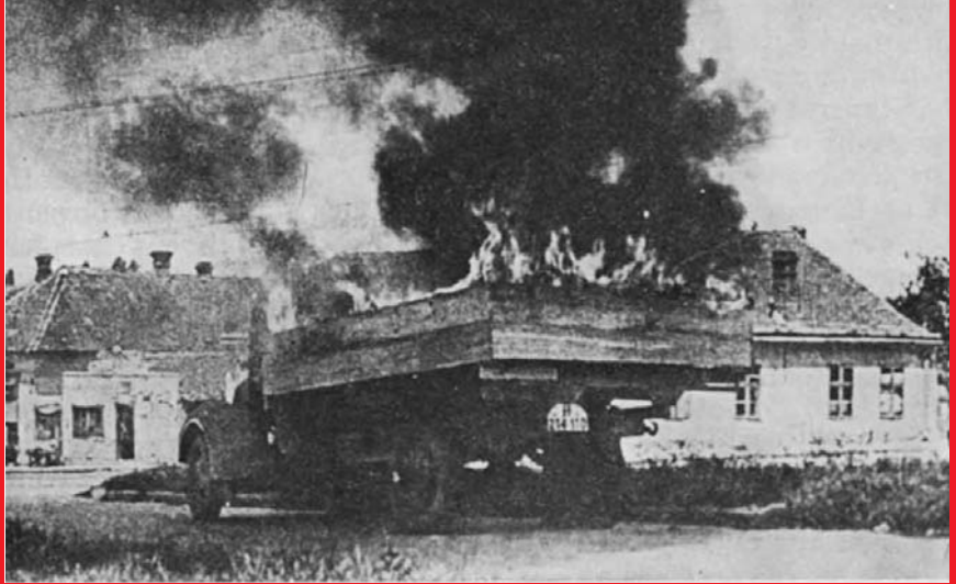
Горео је и немачки заробљени камион