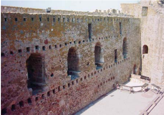
Очувани део грађевине