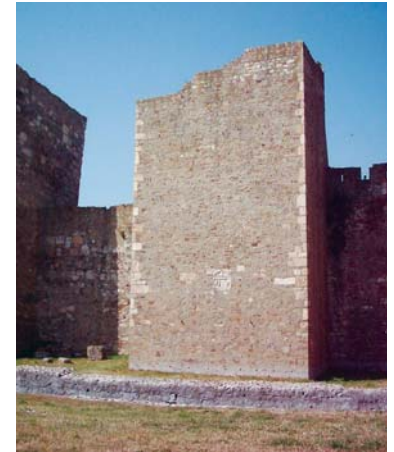
Делови утврђења су у веома добром стању

донекле враћен пређашњи изглед, а цела тврђава се од 1946. године налази под заштитом државе. Мали град је често поприште културних и спортских манифестација, а током Смедеревске јесени он постаје културна престо-ница Смедерева и поприште одржавања многобројних представа и концерата. Првобитна идеја која је постојала при градњи смедеревског града било је подизање утврђеног дворца за деспота и његову породицу уз границу према краљевини Мађарској из које би се они, у случају опасности од Османлија, лако могли склонити на безбедан простор њиховог северног сениора и суседа. Са таквим планом се отпочело са градњом 1428. године под надзором Томе Кантакузина, али је током наредних пола века тврђава била више пута проширивана, дограђивана и прерађивана, да би 1480. године попримила обриси које и данас поседује. У Малом граду је био смештен двор деспота Ђурђа са резиденцијом за становање и палатом за пријеме. Изграђен је 1428–1430. године