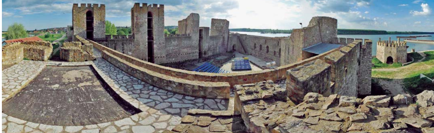
Панорама смедеревске тврђаве