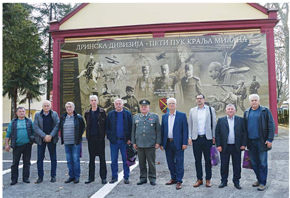
Пред муралом Дринске дивизије: они су обновили рад ОРВС