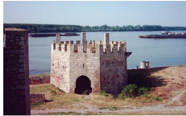
Поглед на Дунав оплемењен средњовековном архитектуром