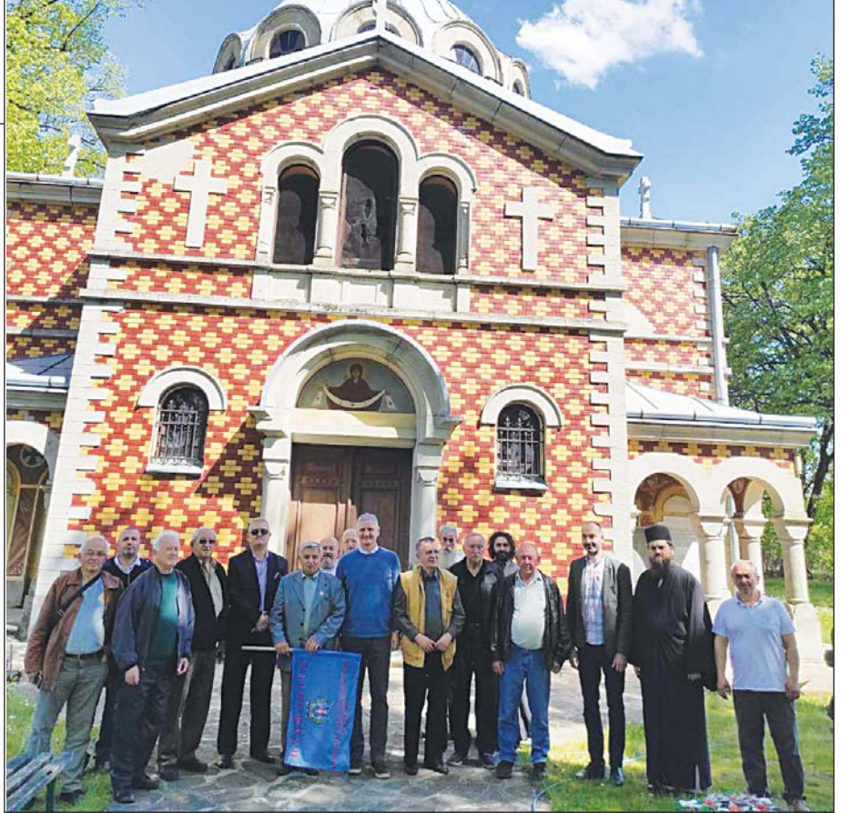
Испред Руске цркве у селу Горњи Адровац

Циљ посете било је информисање припадника организације о степену сарадње и начинима за њено побољшање, с тежиштем на решавању потешкоћа око обимнијег ангажовања резервних војних старешина у спровођењу наставног процеса из области одбране са матурантима средњих школа на територији два војвођанска града после ублажавања епидемијске ситуације.