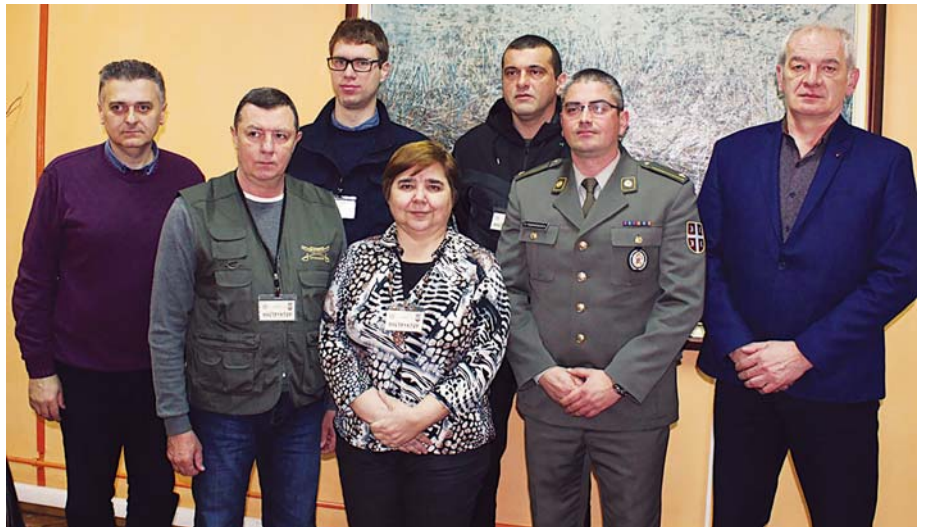
Предавачи тема о одбрани на окупу

Команда Банатске бригаде је у два наврата у сарадњи са школама организовала техничко-тактички збор на коме је присуствовало близу две хиљаде ђака. Када је реч о практичном приказу активности везаних за одбрану и ванредне ситуације ОРВС Зрењанин је у више наврата у Техничкој школи и средњој школи у Српској Црњи организовала пројекат „Полигон ризика“ у коме су на радним тачкама приказивани гашење почетног пожара, пружање прве помоћи, активности Цивилне заштите и самоодбрана.