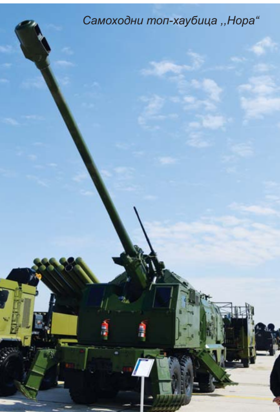
Самоходни топ-хаубица „Нора“