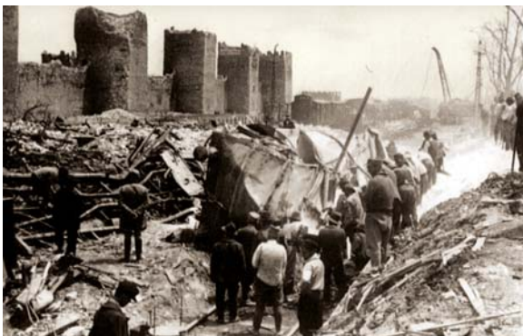
После експлозије 1941. године